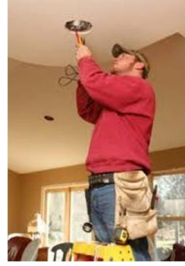
Servicios de electricidad en baja y media tensión.