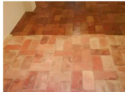
Detalle del antes y después en un suelo tipo rustico de terracota, dando lustre al pavimento con productos anti-manchas y anti-huellas.