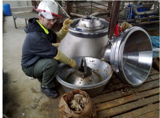
Epis y formación adecuada a cada trabajo, ejem; limpieza en industria química.