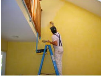
Detalle de pintura mural dentro de una vivienda.