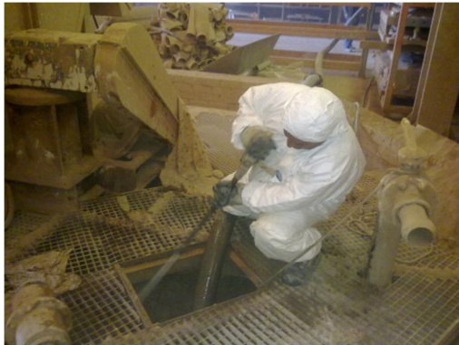
Limpieza de una balsa de captación de lodos.