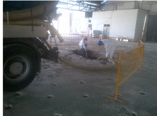
Limpieza de una fosa séptica.