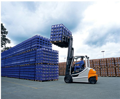
Servicio de carretilleros para todo tipo de industria, con formación y carnet oficial de nuestro personal.