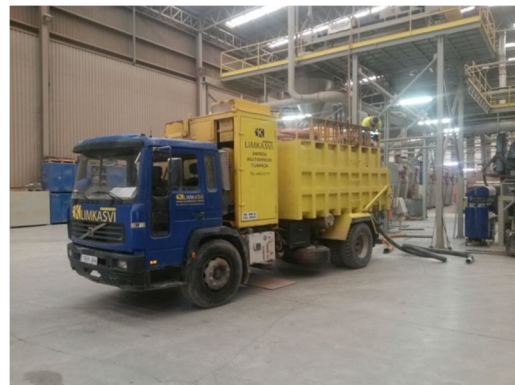
Equipo de aspiración móvil con gran capacidad de recogida y fácil descarga por basculación. Haciendo más efectivo el tiempo real de trabajo.