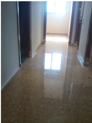
Pulido y acristalado de Terrazo, mármol, granito etc...