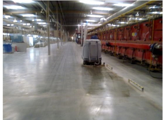
Detalle de un fregado industrial en una fábrica azulejera.