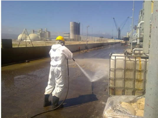
Limpieza de superficies, oficinas, con personal altamente cualificado y material apropiado para cada circunstancia.