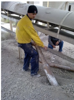
Ejem: aspiración de grava en una cantera.