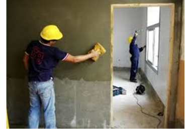
Detalle: reforma menor, colocación de marco puerta y lucido de pared.